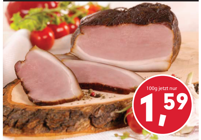
Hausgemachtes Geräuchertes vom Metzger schmeckt's am besten