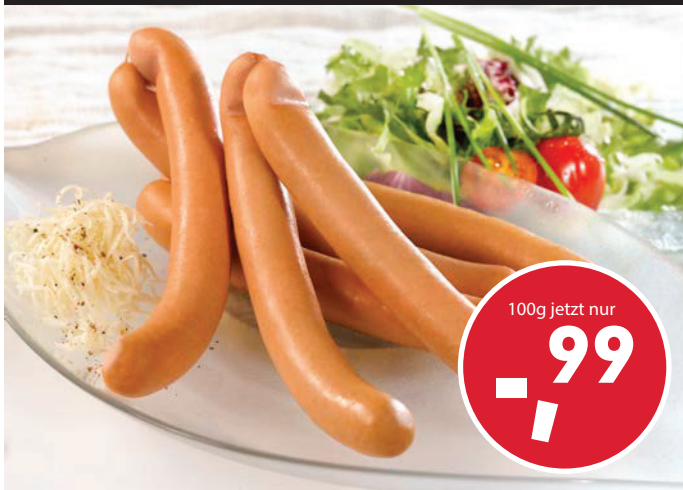
knackig-frische Wiener Würstchen die Klassiker im Würstlopf