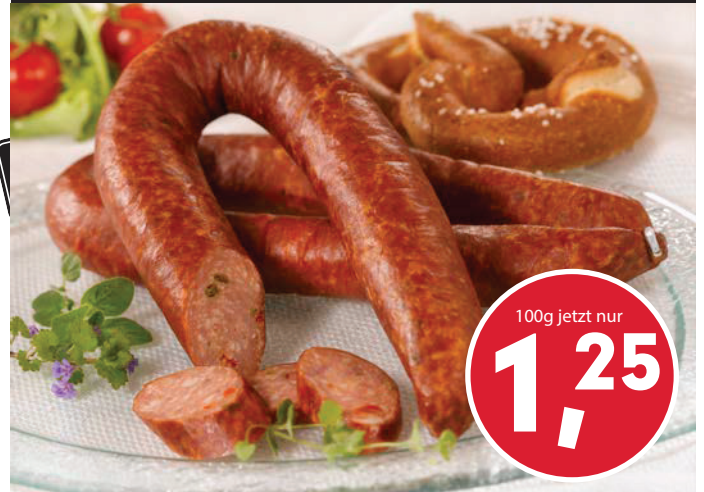
schmackhaftes Brotzeit-Kranzerl immer frisch aus dem Rauch