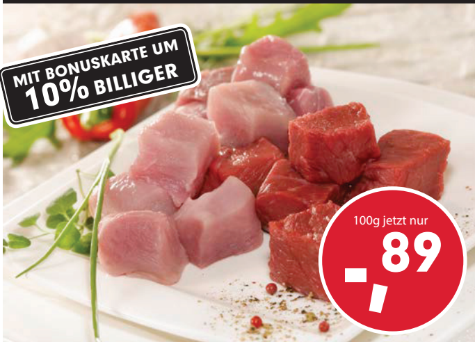
mageres Gulasch gemischt zartes Rind- und Schweinefleisch, sorgfältig gemischt